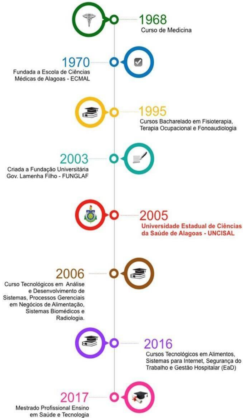
Figura 1: Timeline da história da UNCISAL

Campus Governador Lamenha Filho - Rua Jorge de Lima, 113 - Trapiche da Barra - Maceió/AL. CEP 57.010-300 Fone: (82) 3315-6703 - CNPJ 12.517.793/0001-08