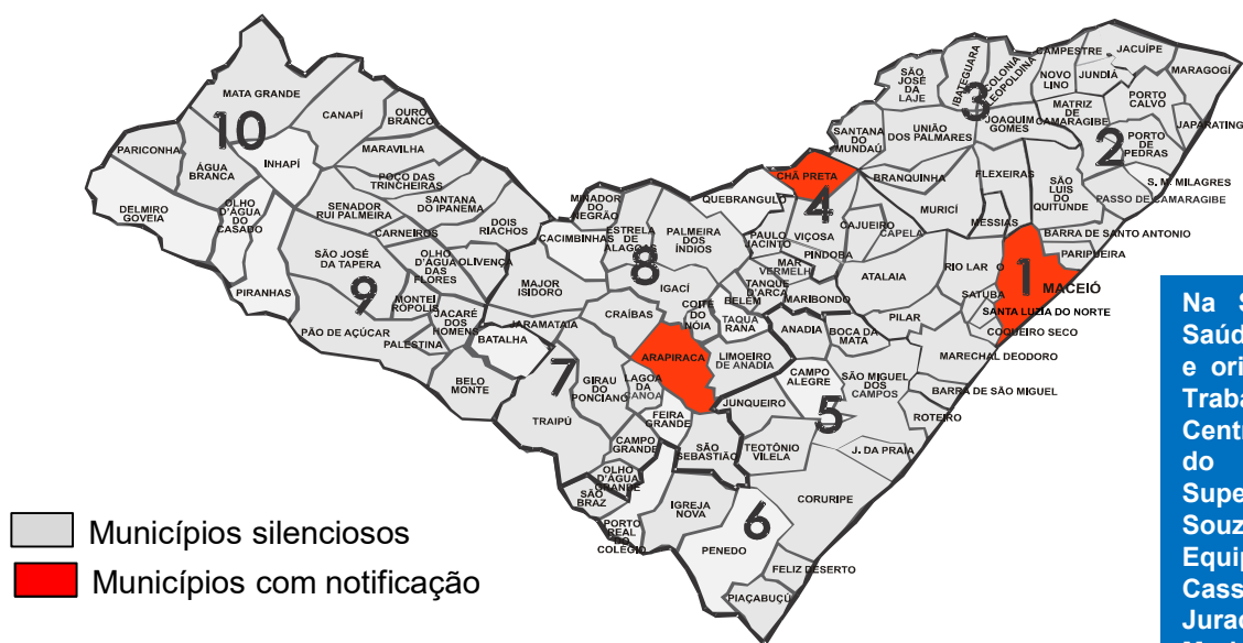
Figura 2: Municípios que notificaram casos de LER/DORT. Alagoas. 2021